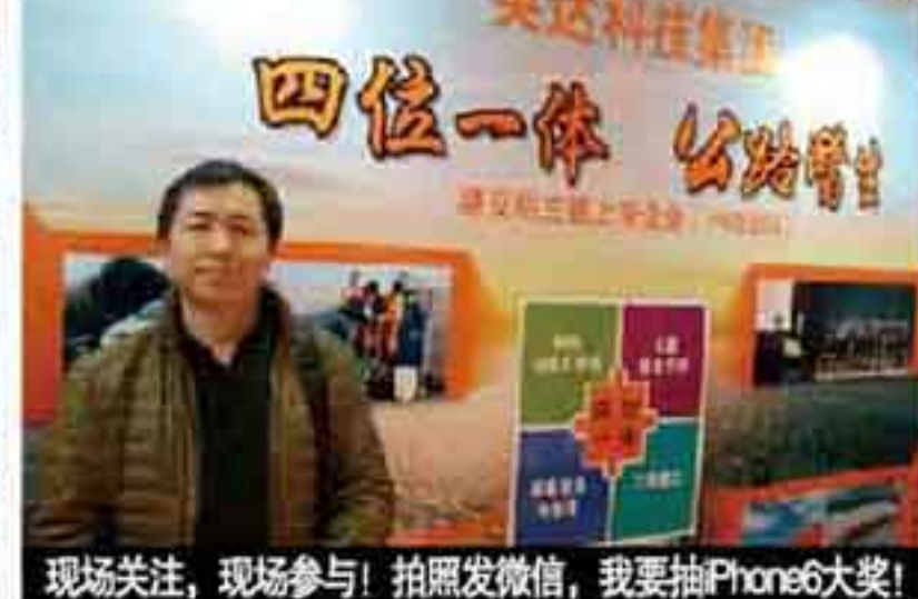
现场关注，现场参与！拍照发微信，我要抽iPhone6大奖！