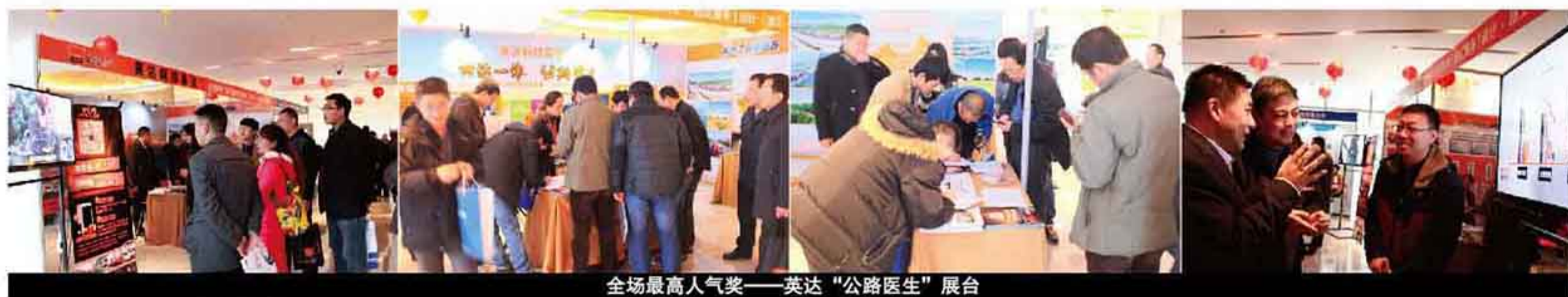
全场最高人气——英达“公路医生”展台