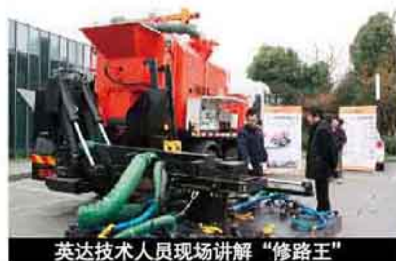
英达技术人员现场讲解“修路王”