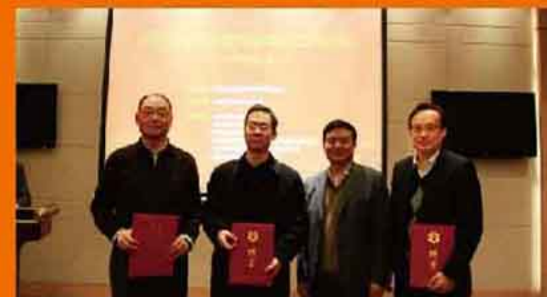
中国公路学会养护与管理分会专家委员会为英达颁发特聘证书