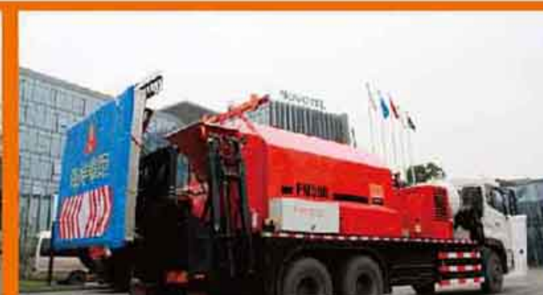
英达明星产品会场外惊艳亮相