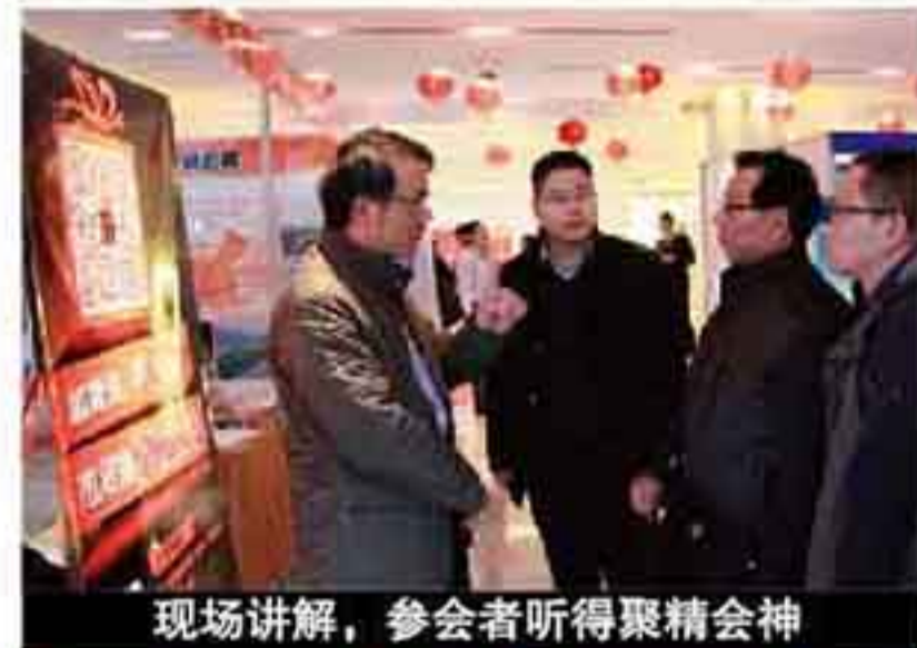
现场讲解，参会者听得聚精会神