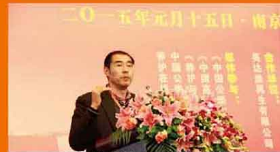
研究中心戴总做英达热再生技术主题演讲