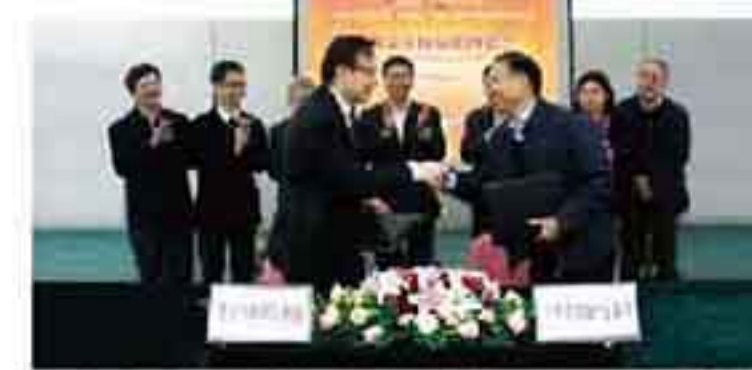
政企合作: 英达与江苏公路局签署协议

8月,英达科技集团与港股上市公司、知名道路投资企业——香港路劲集团,依托英达G307石膏公路热再生工程,共同举办热再生技术鉴定会议,并正式拉开了两个集团战略合作的序幕。