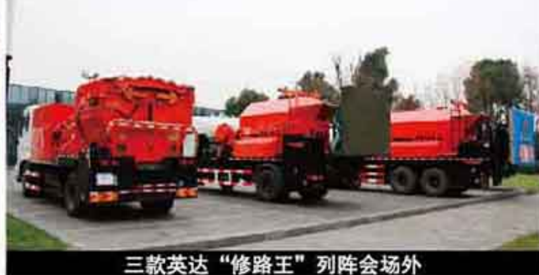
三款英达“修路王”列阵会场外