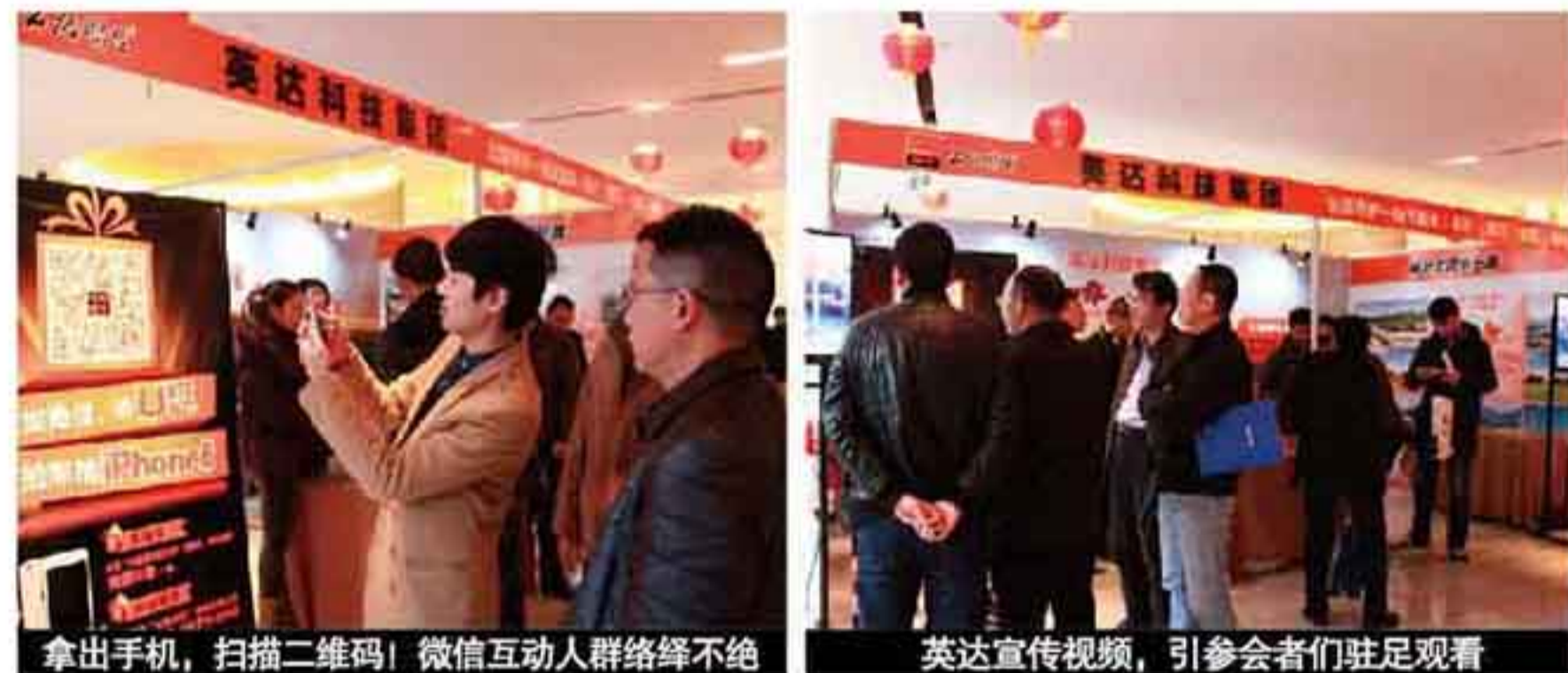
拿出手机，扫描二维码！微信互动人群络绎不绝

年会期间，英达展台还迎来了慕名而来的粉丝：黑龙江省公路勘察设计院的一位参会者径直来到英达展台，要求将10份全套英达技术资料邮寄给他。他说，英达再生技术“名闻天下”，这次很多同行委托他到现场多要一些英达最新的技术资料。