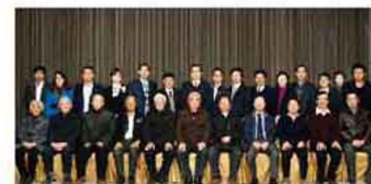
大师云集,英达公路医生学院正式成立

2014年1月,公路医生学院正式注册成立,聘请30位业内顶级专家为公路医生学院教授;此举标志着英达集团集公路医生学院、道路养护技术与材料研究、养护设备研发制造、养护工程施工为一体的“四位一体”经营模式正式形成。