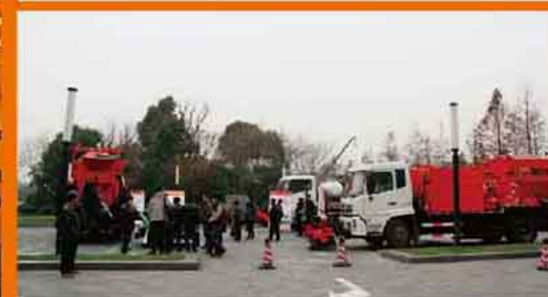
英达设备展吸引了一批又一批参会者前来参观