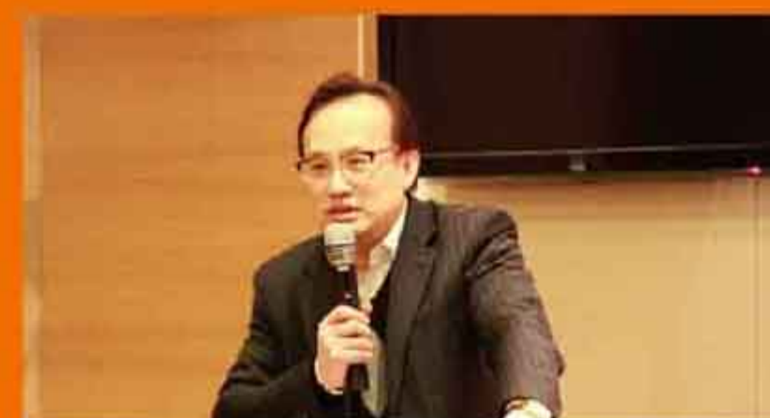
施伟斌董事长为专家委员会会议致辞