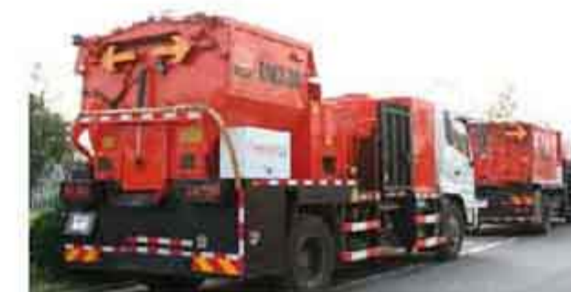
英达TM330,被鉴定为“达到国际先进水平”

2014年,江苏省交通厅委托英达研发的日常养护设备TM330,被专家组鉴定为“国际先进水平”。 2014年11月,英达获得南京市经济和信息化委员会颁布的“南京市企业技术中心”资格认定。