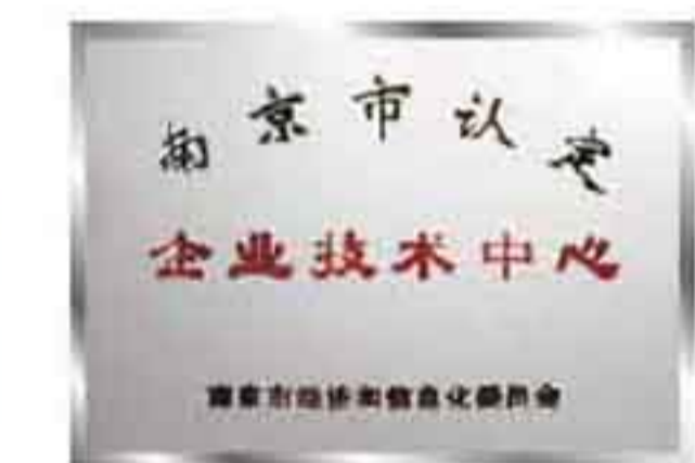
英达获南京市企业技术中心认定

2014年,英达自主研发的PM500、PM390沥青路面热再生修补车和TM500快速加热修补车、HM7沥青路面加热车共4款设备,被江苏省科学技术厅认定为高新技术产品。截至目前,英达已有11款设备获高新技术产品认定。 英达创新研发优化冷再生工艺,并结合英达就地热再生施工,打造了从沥青面层到基层的全路面循环再生体系; 10月,福建厦门三都路英达冷再生施工;11月,广西G323英达冷再生施工。施工后各项指标均满足规范要求。