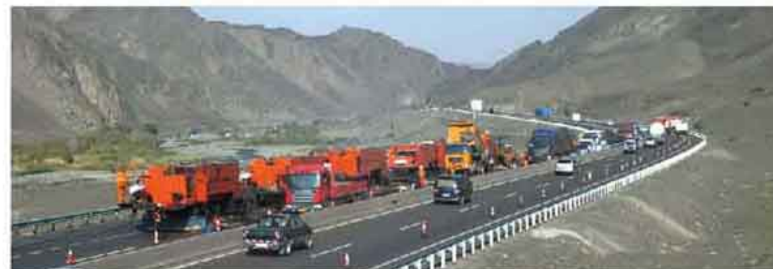
4年数百万平米,“公路医生”英达护航“新丝绸之路”

2014年9月,国家主席习近平提出共建“丝绸之路经济带”的战略构想,这是中国政府首次就洲际经济合作一体化指明道路。建设“丝绸之路经济带”,交通务必先行。从2010-2014年,英达热再生连续4年,在“丝绸之路”核心区新疆,成功完成数百万平米道路养护工程,为“丝绸之路”交通枢纽的畅通立下汗马功劳。