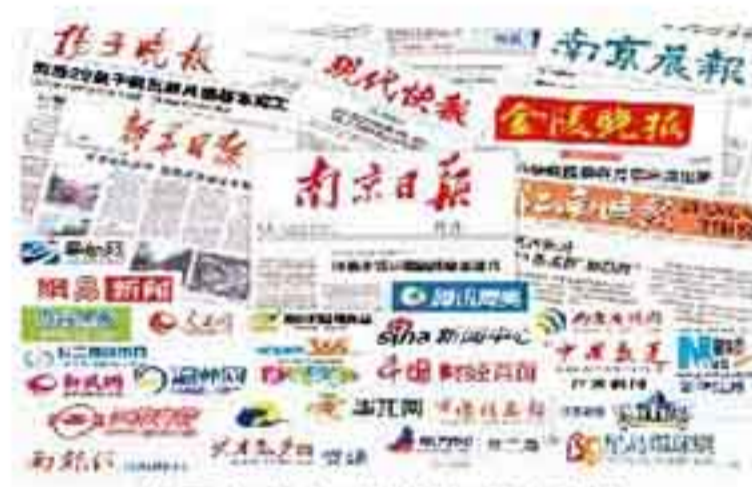
全国众多权威媒体“点赞”英达青奥会道路治理

17条道路,累计施工面积70万平米,英达唱响青奥会道路治理最强音。经测算,此次青奥项目,英达节约新石料达4.3万吨,减少废料排放7万吨。英达的环保施工,获得了业主和专家的大力认可,同时也获得国内数十家媒体的采访报道。