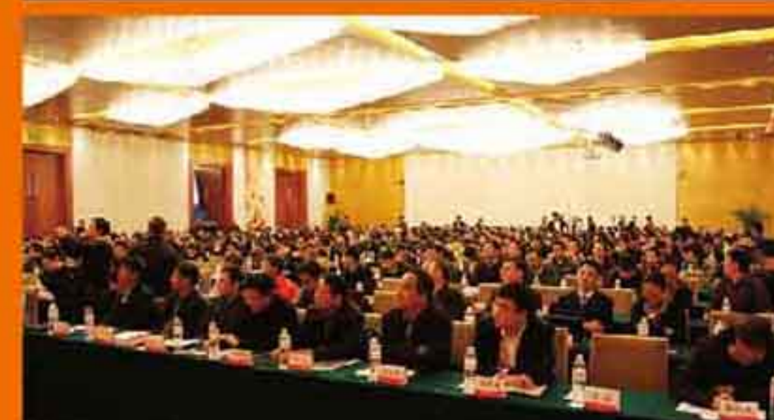
来自全国的专家、学者齐聚一堂

1月15日至16日，2014年中国公路养护与管理学术年会隆重召开，900多名来自全国公路系统、科研院所的领导、专家、学者齐聚南京，共论“材料循环与新技术应用”。本次年会的规模与出席人数远超历届，盛况空前。