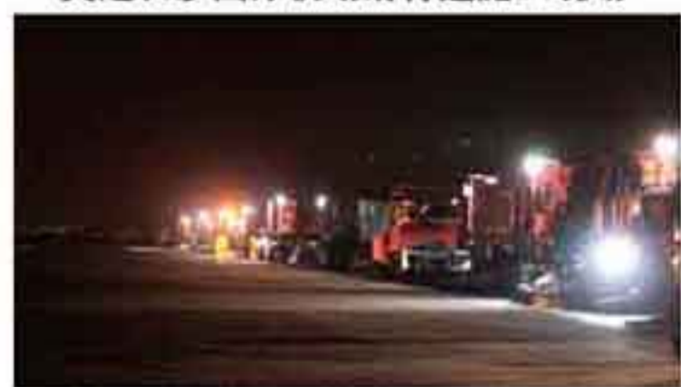
英达湛江机场跑道热再生施工现场

2014年10月,广东湛江机场,英达采用复拌就地热再生工艺治理沥青跑道,让使用17年之久的道面重获新生。