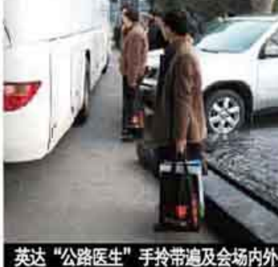
英达“公路医生”手持带道及会场内外