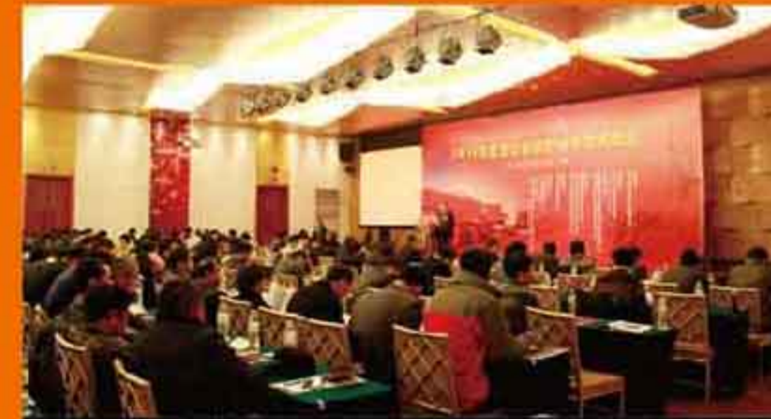
英达公司热再生技术报告引发极大关注